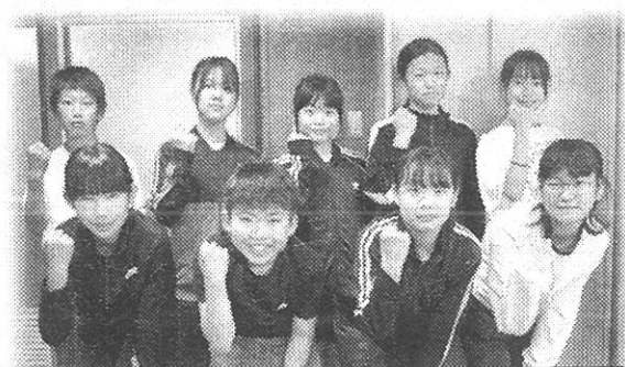
通学班リーダー・運動・給食・図書・生活 美化・保健・放送・本部 委員長

4月15日各委員長と通学班リーダーが、今年頑張りたいことを全校朝会で話しました。どの子も蜂屋小学校をよくしたいという思いが伝わる話し方と内容でした。この委員長・リーダーを中心に、子供たち一人一人が主体的に学校をよりよくする中で、あったか蜂屋っ子を目指します。応援よろしくお願いします。